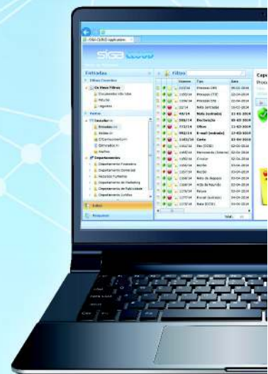
LISTA DE TRABALHO