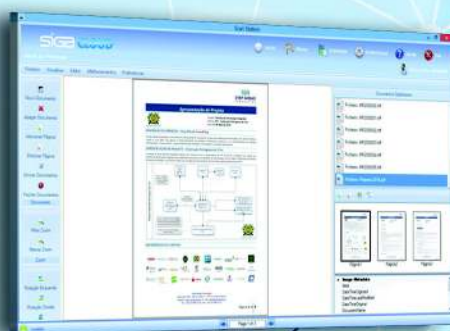
VISUALIZAÇÃO DE DOCUMENTOS